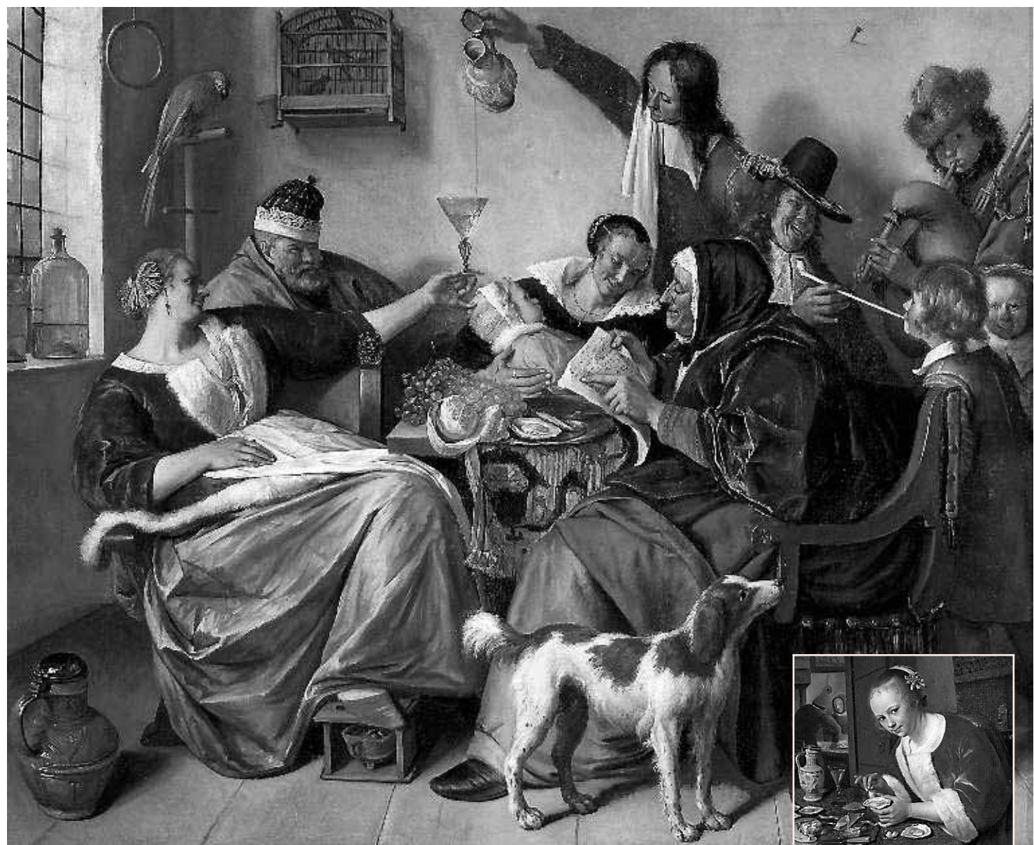
Jan Steen - Soo voer gesongen, soo na gepepen en detail van Het Oesterestertje.

Leven in de brouwerij heet de expositie en die uitdrukking is in alle opzichten van toepassing op Jan Steen, schilder van amuseante en volkse tafereel. Op zijn doeken zie je rondhollende kinderen en bandeloze volwassenen die stevast het slechte voorbeeld geven. Ze zijn zo kenmerkend voor zijn stijl dat een huishouden van Jan Steen in het Nederlands taalgebruik staat voor een chaos en bende. Ook het gezegde leven in de brouwerij hebben we aan hem te danken. Het is ontleend aan een anekdote uit de 18de eeuw. Jan Steen, die ook een brouwerij bestierde, zou zijn bedrijf hebben laten verslonzen, waarop Steens' vrouw hem aanspoorde de boel levendig te houden. Steen kocht daarop wat eenden die hij in de brouwerij liet