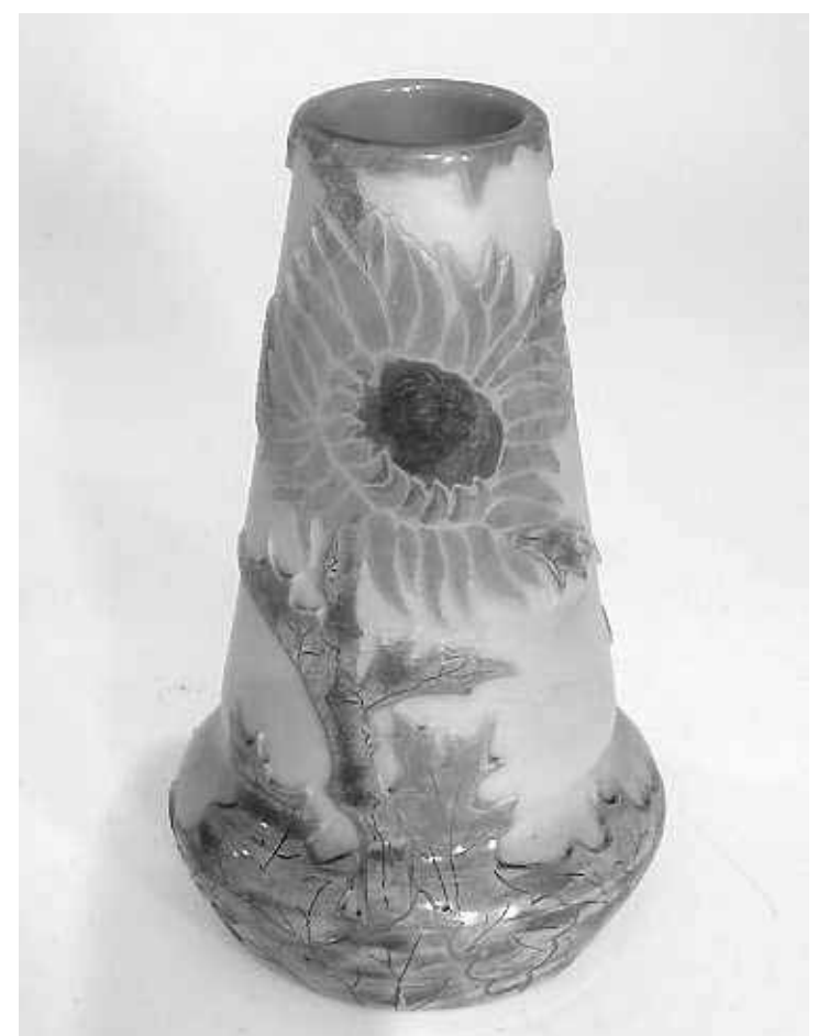
De Legrasvaas waarvan geen tweede bekend is. PUBLICITEITSFOTO

De Nationale Art Deco Beurs in de Grote Kerk, Torenstraat Den Haag, is vandaag en morgen van 11.00 tot 19.00 uur geopend, zondag van 11.00 tot 18.00 uur, toegangsprijs € 12, kinderen tot 12 jaar gratis.