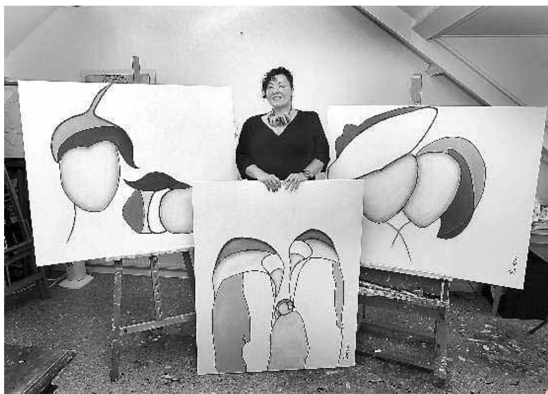
Broeri en haar schilderijen.