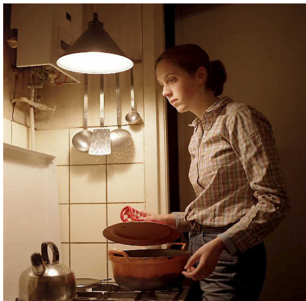
De genomineerde foto 'Huishouding 2'.