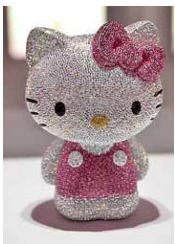
Hello Kitty, uitgevoerd met 19.636 Swarovski steentjes.

Een al jaren lopende discussie is de vraag of Hello Kitty niet heel erg veel lijkt op de twintig jaar eerder ontworpen Nijntje.