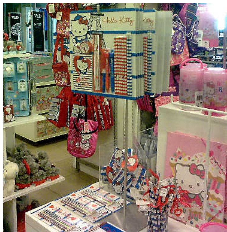
Hello Kitty-hoekje in V&D in Leiden.