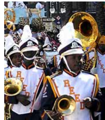
High School Band.

DOOR AD VAN KAAM KATWIJK - In Amerika is het fenomeen van de High School Band onveranderd populair. Katwijk gaat er nu ook mee kennismaken. Elke middelbare school in Amerika heeft er eentje - een High School Band. Ze worden ingezet bij officiële presentaties, bij feesten en ter omlijsting van sportwedstrijden. Een aantal van die bands is op tournee door Europa. Ze reizen rond door Frankrijk, België, Duitsland en Nederland. Volgende week doen ze ook Katwijk aan. Verdeeld over twee dagen is er aantal concerten in de Vredeskerk aan de Voorstraat. Op woensdag 6 juli geven 135 jong Amerikaanse muzikanten een demonstratie van hun kunnen