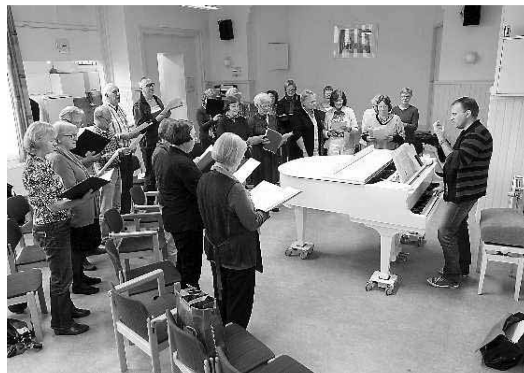
Het Overdagkoor repeteert in de Romanuszaal in Leiden.