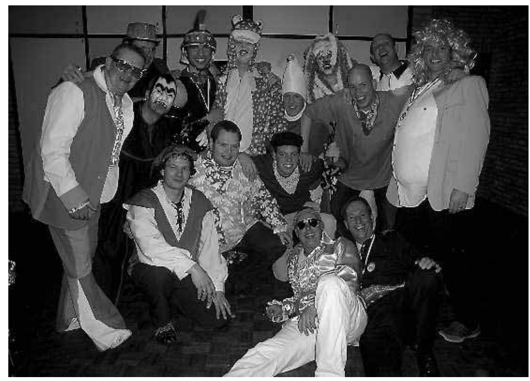
Blaaskapel De Stropers tijdens het Bal Masqué.